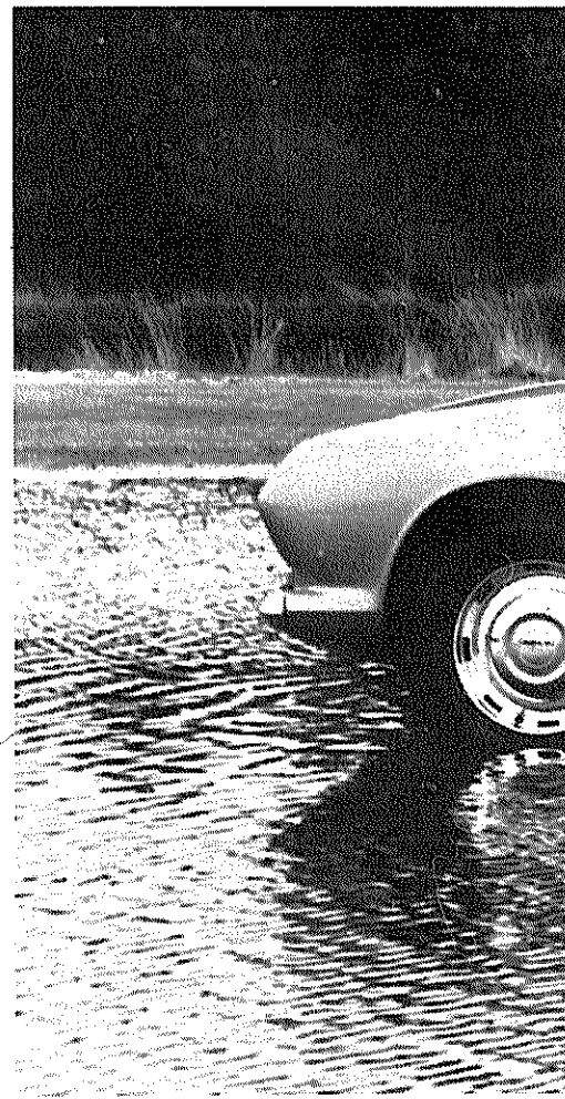
Onder: Het bijzonder goed afgewerkte en van alle

De Scimitar is een wagen vol tegenstellingen. Aan de ene kant vindt men een wisselstroom dynamo, aan de andere kant blijkt dat de achterwielophanging uit een starre as be-