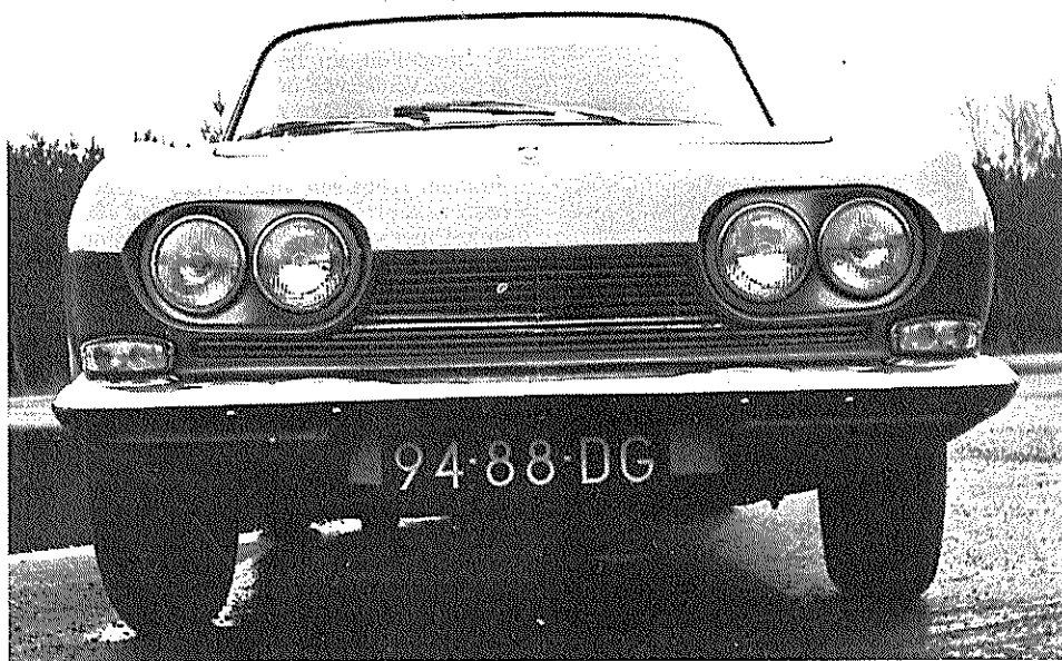
Van de vier koplampen wordt 1 stel voor dimlicht gebruikt, alle 4 voor grootlicht.

Onder weersomstandigheden, die zelfs de meest verstokte pessimisten sterk aan de lente deden denken, werd op 31 januari de Scimitar in Nederland ten doop gehouden. Deze voor Nederland geheel nieuwe sportieve luxe wagen wordt in Engeland door de Reliant Motor Company Limited vervaardigd. De naam van deze fabriek zal U niet helemaal onbekend voorkomen, sinds verleden jaar werden immers ook al de driewielige produkten van Reliant in Nederland vertegenwoordigd. Van deze, voor motorrijbewijshouders geschikte driewielers zijn er inmiddels een flink aantal verkocht.