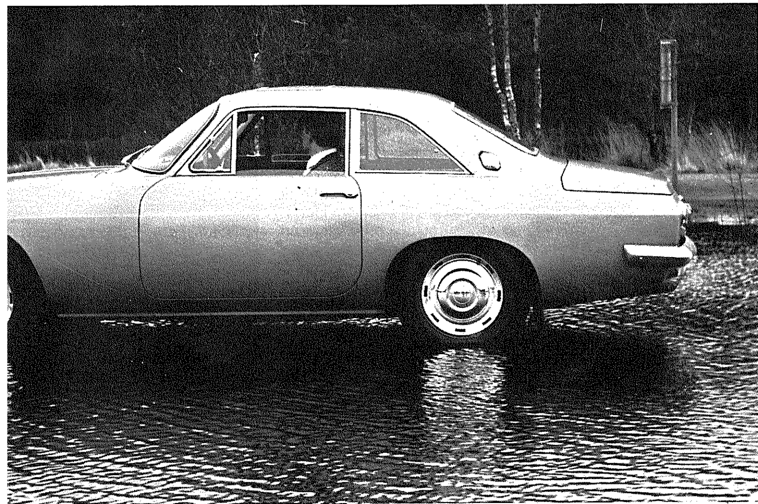
De foto hierboven toont U het zij-aanzicht van de nieuwe Scimitar 3 liter.